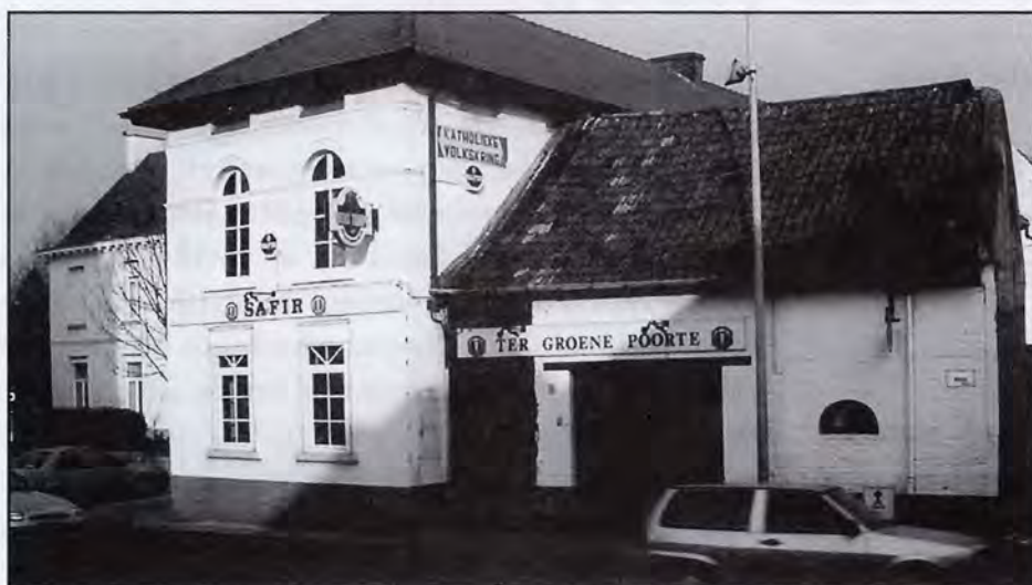
Ter Groene Poorte anno 2000

POPP P.-C., 'Atlas Cadastrale Parcellaire' en bijhorende kaart, (1840)